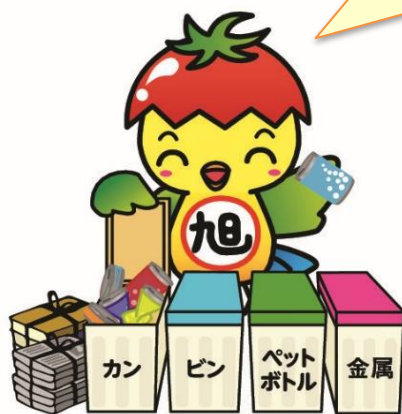
旭市イメージアップキャラクター「あさピー」